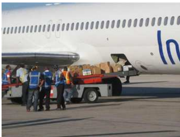
Door SHH gedoneerde hulpgoederen worden ingeladen in het vliegtuig