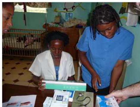
Een zending gedoneerde goederen wordt dankbaar bekeken door medewerkers van het kindertehuis

In dit jaar heeft de stichting met name de focus gehad op de inrichting, de te formuleren doelstellingen en de sponsoring. Op kleine schaal heeft de stichting hulp kunnen bieden aan het kindertehuis Bresma te Port-au-Prince met wie zij reeds contact had. Deze hulp bestond uit het aanbieden van medicamenten voor de ziekenboeg van het kindertehuis. Dit was tevens ook de aanleiding om te beoordelen wat de oorzaak was van het medicijngebruik en welke invloed en van daaruit welke oplossing de stichting zou kunnen bieden om het gebruik van medicamenten te reduceren. Hierbij kwam met name de hygiëne in het kindertehuis naar boven. Dit bracht de stichting erop om de pijlen te richten op het sanitair en de keukenhygiëne. Daarnaast werden kinderkleding en kinder- en babyartikelen op het gebied van hygiëne geschonken. Sponsoring kwam met name van persoonlijke relaties en connecties met medische organisaties en van andere ouders met kinderen die geboren zijn in Haïti.