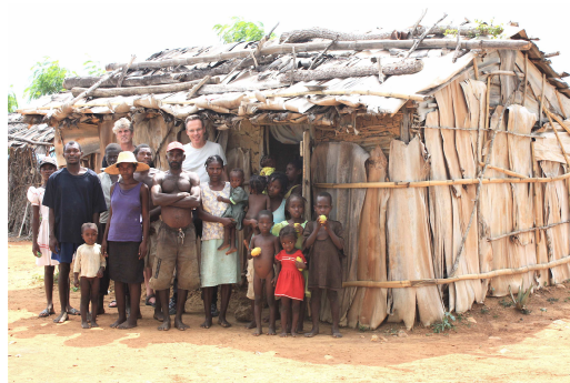
De voorzitter en de relatie van het medebestuurslid van SHH samen op de foto met een gezin en hun hutje in leefgemeenschap Californe.