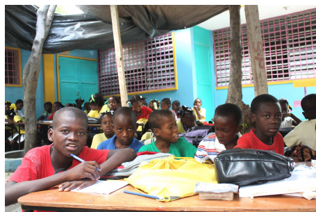
Kinderen op de Bresmaschool