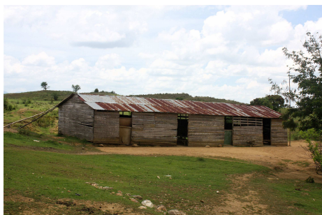
De school annex kerk waar SHH een verbeterde of vernieuwde voorziening voor wil treffen.

Monitoring: Door een medewerker van OEEPC 1